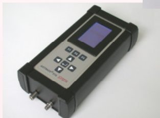
Mobile Variante: ARTINOS® 510 Für den flexiblen Einsatz vor Ort