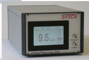
Stationäre Variante: ARTINOS® 210 Autonomer Betrieb über Touchscreen