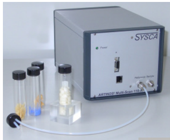
Stationäre Variante: ARTINOS® 110 Umfassende Ergebnisanzeige über PC-Software

Die Messwerte können optional als Analogsignal ausgegeben und für die vollautomatische Regelung industrieller Prozesse verwendet werden.